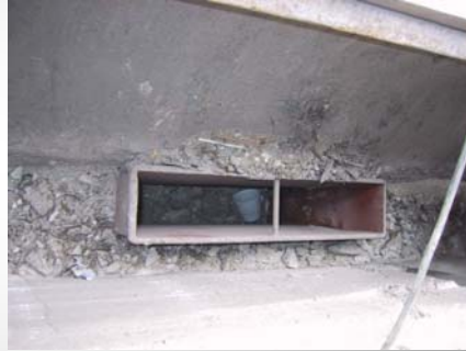
Sometime there is no Air connection