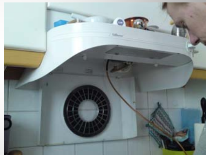
Odor extraction compared to Building Code