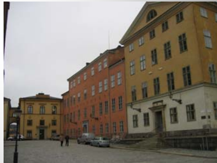
Not allways suitable to rent to all kind of use, due to lack of ventilation or Air Condition installations