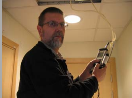
Digital equipment with a computer connection